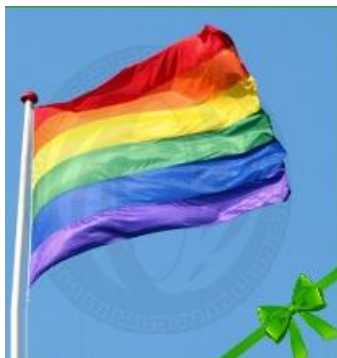
Шестицветная радуга – флаг содомитов

Легализация в некоторых странах однополых сожительств, разрешение таким парам усыновлять детей и подобное – не что иное, как превращение нашей земли в Содом и Гоморру. Мы это видим. Но, увы, подчас, толерантно проходим мимо.