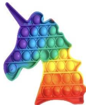
Единорог – один из символов содомитов

Легализация в некоторых странах однополых сожительств, разрешение таким парам усыновлять детей и подобное – не что иное, как превращение нашей земли в Содом и Гоморру. Мы это видим. Но, увы, подчас, толерантно проходим мимо.