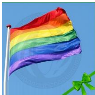
Шестицветная радуга – флаг содомитов