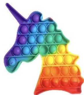
Единорог – один из символов содомитов