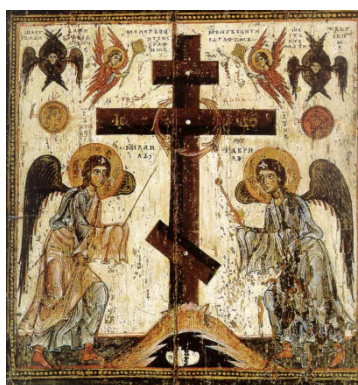
Поклонение Кресту. Первая половина XII в.

Если же мы верно и, главное, со смирением следовали посту - воздадим хвалу Господу, дающему нам на это силы.