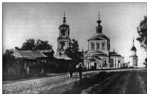
Пятницкий храм и церковь свв. апостолов Петра и Павла. г. Сергиев. Фотографии 1940-х гг.

13 сентября 1937 г. расстрелян вместе с другими священниками и погребен в общей безвестной могиле Западно-Сибирского края.