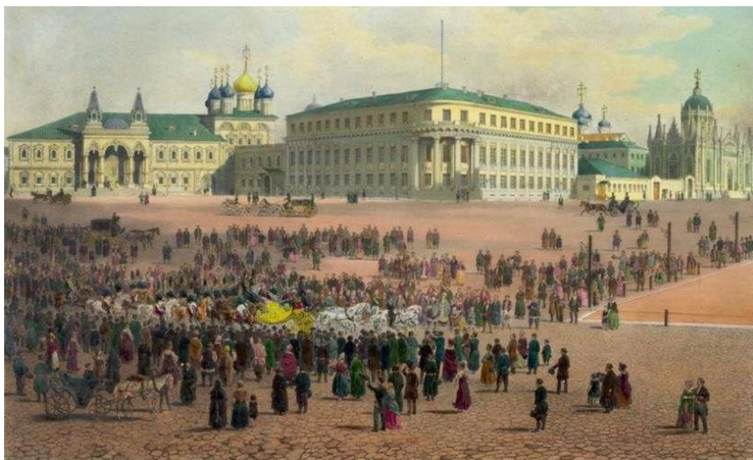
Чудов монастырь, Малый Николаевский дворец, Вознесенский монастырь.

В 1930 году Чудов монастырь был разрушен, потребовалось место для размещения школы кремлевских курсантов. Перед сносом, администрация Кремля вызвала художника Павла Дмитриевича Корина (1892-1967) для демонтажа наиболее ценных фресок, однако не дала ему завершить работу. Собор был уничтожен вместе со фресками. В день сноса Петр Дмитриевич Барановский (архитектор-реставратор, 1892-1984) — последний человек, видевший интерьеры Чудова монастыря — успел лишь вынести из здания раку св. Алексия. Сохранившиеся фрагменты фресок экспонируются в Третьяковской галерее, Историческом музее, Музее Андрея Рублёва. В настоящее время существует проект восстановления Чудова монастыря на прежнем месте.