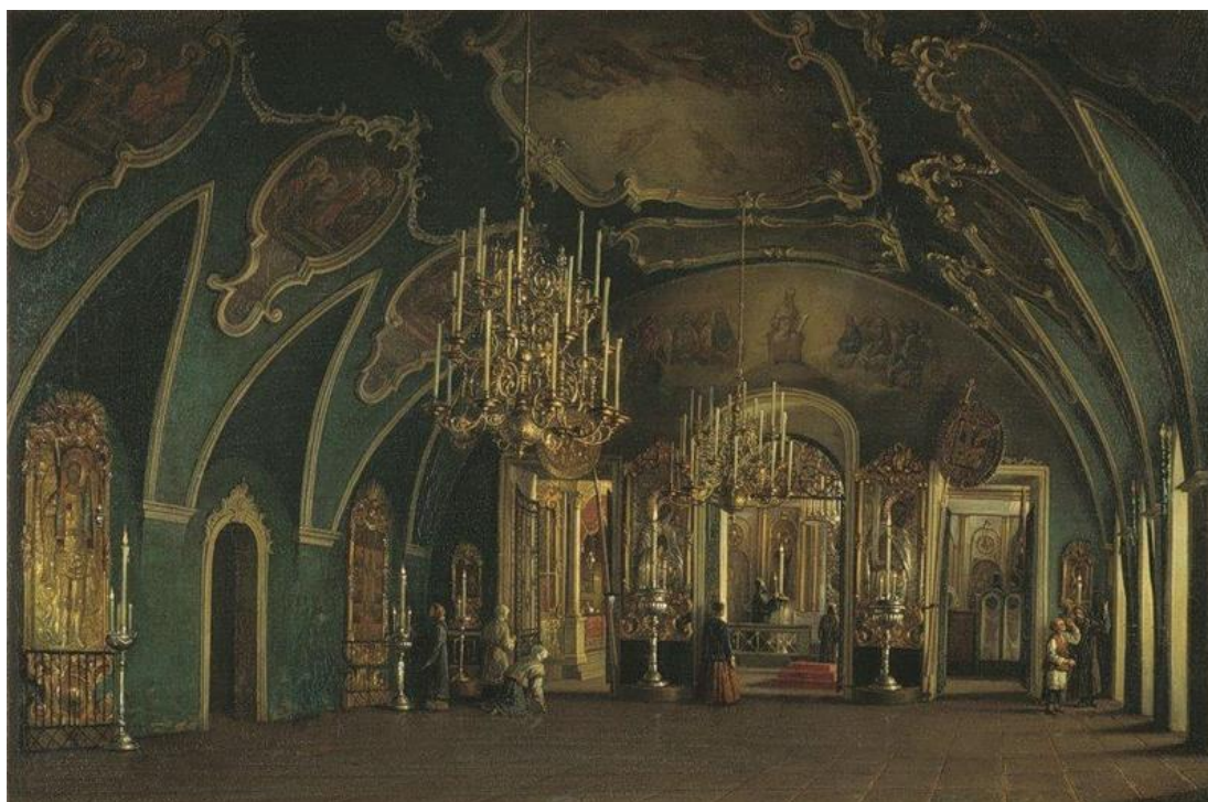
Алексеевская церковь Чудова монастыря в Московском Кремле