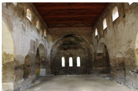
Зал 1-го Вселенского Собора

"Слушайте! Пока состязание со мною велось посредством доказательств, я выставлял против одних доказательств другие и своим искусством спорить отражал всё, что мне представляли. Но когда, вместо доказательства от разума, из уст этого старца начала исходить какая-то особая сила, доказательства стали бессильны против нее, так как человек не может противиться Богу. Если кто-нибудь из вас может мыслить так же, как я, то да уверует во Христа и вместе со мною да последует за этим старцем, устами которого говорил Сам Бог".