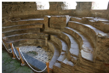
Каменные скамьи, на которых сидели участники Собора