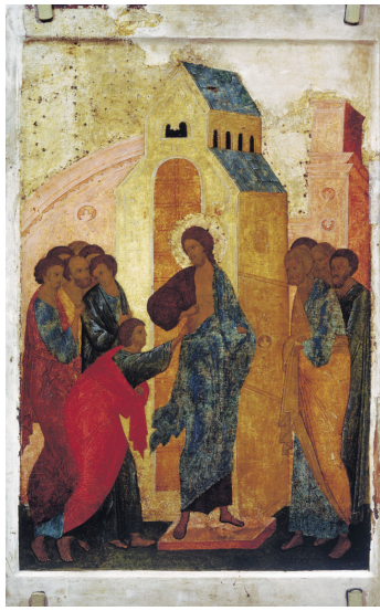
Дионисий. "Уверение Фомы" 1499