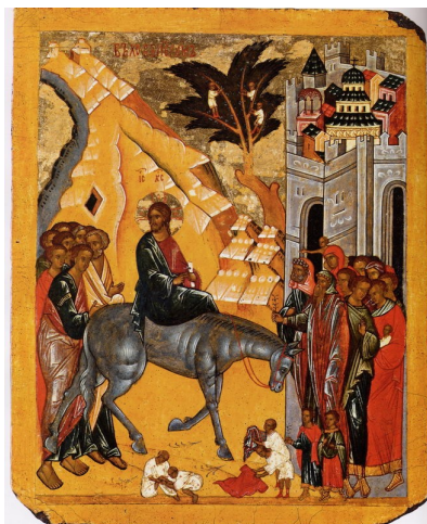
Вход Господень в Иерусалим. Андрей Рублев. 1405 год. Главный иконостас Благовещенского собора в Московском Кремле

После воскрешения Лазаря Христос пошел в город Иерусалим. И когда приблизились к Иерусалиму, Иисус послал двух учеников, сказав им: «Пойдите в селение, которое прямо перед вами; и тотчас найдете ослицу привязанную и молодого осла с нею; отвязав, приведите ко Мне; и если кто скажет вам что-нибудь, отвечайте, что они надобны Господу; и тотчас пошлет их».