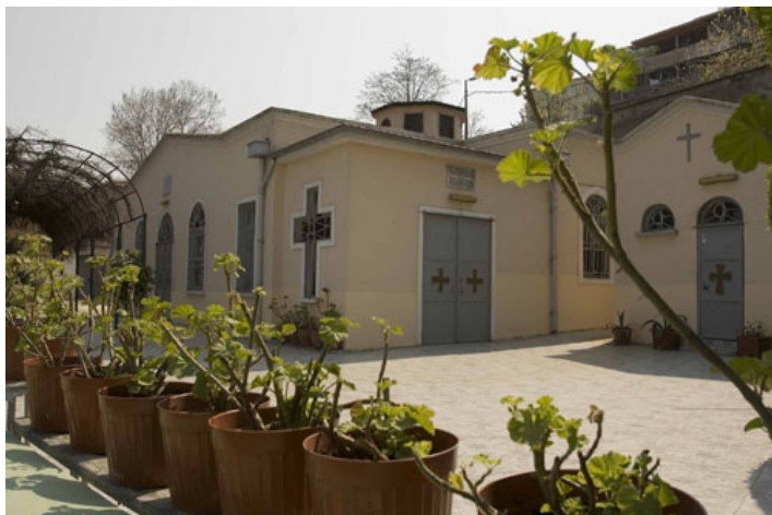
Храм во Влахерне на месте того храма, где первый раз прочитали акафист Пресвятой Богородице