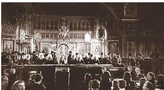
Поместный Собор 1917–1918 годов, избравший Патриарха Тихона

Как член Поместного Собора 1917—1918 годов, Иларион (Троицкий) вдохновенно выступил на Соборе в защиту патриаршества: