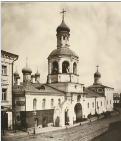
Сретенский монастырь. 1881 год

22 июня/5 июля 1923 года святитель Иларион прибыл в Сретенский монастырь, изгнал из него обновленцев и отслужил всенощное бдение под праздник Владимирской иконы Божией Матери.