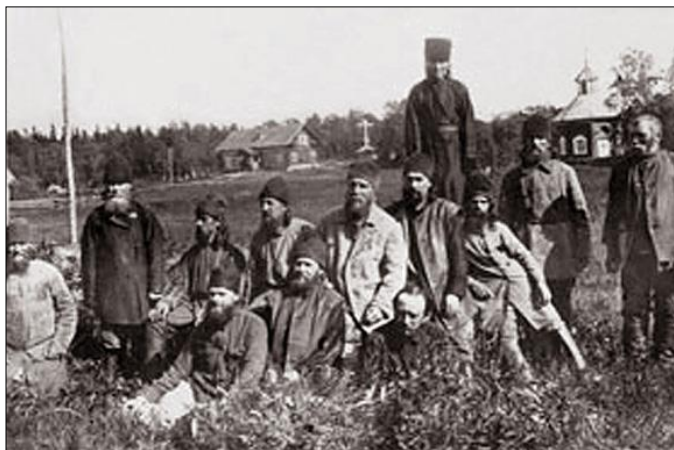
Архиепископ Иларион (Троицкий) среди духовенства в Соловецком лагере (седьмой слева).

Весной 1926 года святитель вновь оказывается на Соловках. По-прежнему судьба Церкви занимает все его помыслы.