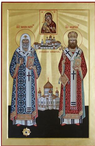
Патриарх и святитель Иларион (Троицкий)

К моменту участия в Соборе отца Илариона его известность и авторитет уже вышли за пределы академии. Во время Собора «его, единственного не епископа, в кулуарных разговорах называли в числе желательных кандидатов на патриарший престол».