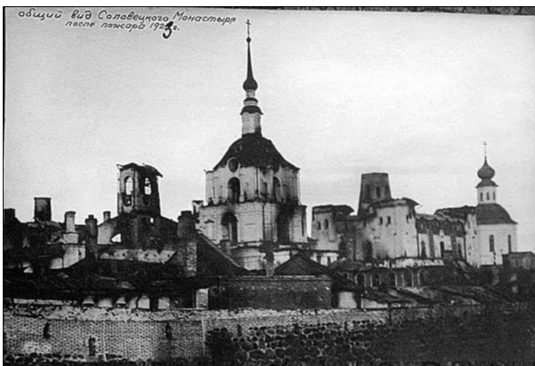
Соловецкий монастырь. 1923 год