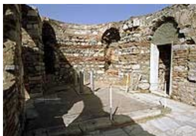
Мои́ла в Ефесе, где погребен апостол Иоанн Богослов

Узнав об этом, остальные ученики апостола пришли к месту его погребения и раскопали могилу, но ничего в ней не нашли. С тех пор каждый год из гроба его выступал тонкий прах, который верующие собирали и исцелились им от болезней.