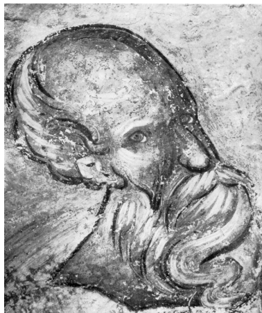
Иоанн Богослов. Фреска церкви Успения на Волотовом поле. Около 1380 г.

Апостолом любви именуется Церковь святого Иоанна, ибо он постоянно учил, что без любви человек не может приблизиться к Богу.