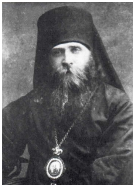
Сщмч. Лаврентий (Князев) епископ